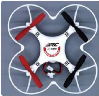
手機藍芽遙控無人機