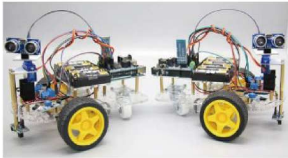
藍芽無線控制自走車